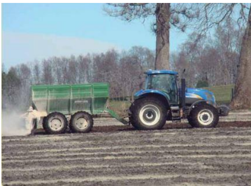
Imagen 2. Aplicación de enmienda con cal dolomita previo a su incorporación.

Es siempre recomendable que un ingeniero agrónomo dictamine la dosis de dolomita a ser usada, sin embargo, por regla general se recomienda aplicar mínimo 2 toneladas de DOLOMITA, por hectárea. Esta debe aplicarse de manera uniforme al voleo o con arado mínimo de 30 días antes de que el cultivo sea sembrado, trasplantado, para que la dolomita pueda reaccionar y mejorar la estructura del ya su vez bajar la acidez.