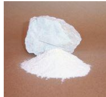
Imagen 3. Cal dolomita de alta pureza granulometría malla 100

La finura del material representa una medida de la velocidad de reacción de la cal agrícola. Mientras más fino es el material, tiene más superficie de contacto con el suelo para neutralizarlo y, por lo tanto, reacciona más rápido. Las cales con finura mayor a 100 mallas (mallaje establecido por la industria americana), son de alta eficiencia agronómica, mientras que las partículas retenidas por malla 10 no tienen valor como enmienda (sin efectividad agronómica). Las partículas retenidas por malla 60 ya presentan limitaciones; en cambio, las partículas que pasan por malla 60 y superiores son de adecuada eficiencia.