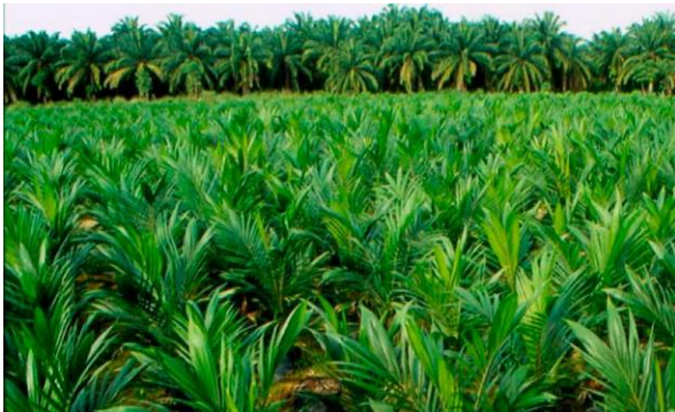
Imagen 1. Cultivo de Palma de Aceite.

El Magnesio está directamente relacionado con el nivel de pH, y además es el nutriente que más sistemas enzimáticos activa lo cual es vital para el proceso de fotosíntesis y muy importante en el llenado de granos y frutos.