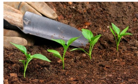
Imagen 2. Aplicación de Abono Orgánico con residuos de palma de aceite.

Los abonos orgánicos son sustancias que están constituidas por desechos de origen animal, vegetal o mixto que se añaden al suelo con el objeto de mejorar sus características físicas, biológicas y químicas. El uso de abonos orgánicos resulta más amistoso con el medio ambiente en comparación con el resto de los abonos. Permiten, por ejemplo, reutilizar los desechos orgánicos, contribuyen a fijar el carbono al terreno, requieren de una menor cantidad de energía para su producción y ayudan a incrementar la capacidad del suelo para la absorción de agua.