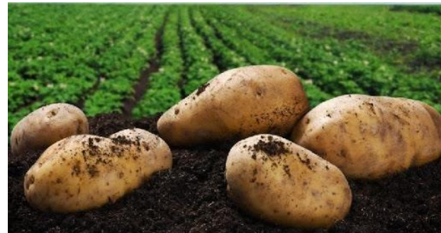
Imagen 3. Cultivo de papa.

El abonamiento consiste en aplicar las sustancias minerales u orgánicas al suelo con el objetivo de mejorar su capacidad nutritiva, mediante esta práctica se distribuye en el terreno los elementos nutritivos extraídos por los cultivos, con el propósito de mantener una renovación de los nutrientes en el suelo. El uso de los abonos orgánicos se recomienda especialmente en suelos con bajo contenido de materia orgánica y degradada por el efecto de la erosión, pero su aplicación puede mejorar la calidad de la producción de cultivos en cualquier tipo de suelo.