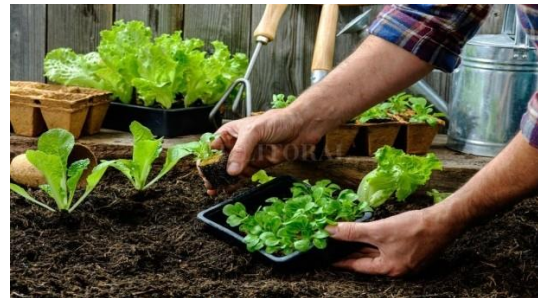
Imagen 4. Siembra de lechuga después de aplicar abono orgánico.

Los vegetales, prados, pastos y cultivos en hilera prosperan mejor en suelos dominados por bacterias. Hay varias razones para ello: las bacterias producen una baba alrededor de sus cuerpos la cual usan para pegarse a las superficies de las raíces y coloides suelo. Esto previene que ellas sean lavadas del suelo, arrastradas por el agua, así que ellas retienen los nutrientes del suelo. Pero la capa pegajosa, es a menudo hecha de materiales alcalinos, lo que puede causar que el suelo se vuelva más alcalino. Las bacterias son comidas por protozoarios y nematodos comedores de bacterias, liberando amonio en el suelo. En condiciones alcalinas,