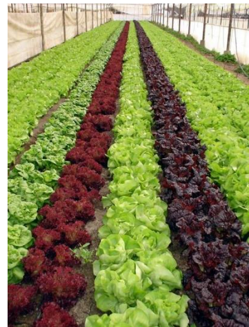
Imagen 1. Cultivo de Lechuga