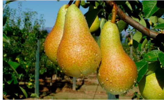
Imagen 5. Cultivo de pera.

El compost a utilizar debe ser homogéneo y no debe notarse el material de origen que ha sido utilizado al inicio de la preparación, además debe tener un olor parecido a la tierra de los bosques y la temperatura en el montón no debe ser diferente a la temperatura del ambiente.